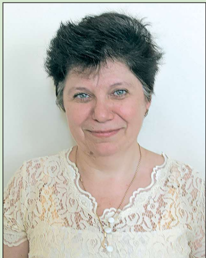
Точка зрения главного редактора