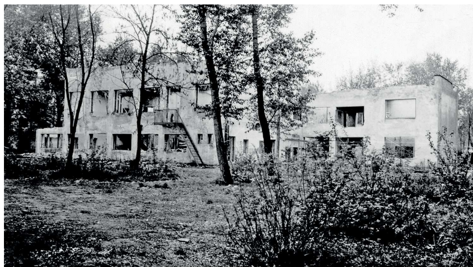
ул. Савина, 8а 1933 быв. детясли №1 Каменное двухэтажное здание. Решено в стиливых формах позднего конструктивизма. Рекомендуется как исторически ценный средовой объект.